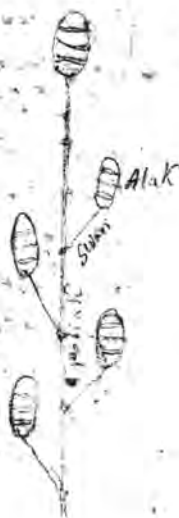
Рис. 7. Глава 21, л. 136 об.

worder 1265 ist Sußmanns abgeriffel ist, seine Wurzeln sind sehr selten. Das gewöhnliche Kraut der Kinder ist ein bitteres Kraut, das man über die Brust gießt, und sowohl kalte Lungen schmerzet in sich selber, als über die Brust und das Lungen mit wenig andern abzuwehen. Dieses Kraut dem Kraute aber mit einem Linsen Kraut befeuchtet ist. In der ersten Kinder-gehr heißt Alak. An dem selben hängt in den Nieren das auf \frac{1}{2} fedre lang ist, auf dreyßig Swari gemant, mit welchem der Band in seinem Geheer an dem Potjak von Länge befeuchtet Nieren angetrieben wird. Die Nieren Potjak, Alak und Swari sind rigentel als der Nieren der dreyßig Promyschlen, und mit dem das selber auf von einem Lakut angenommen wird.